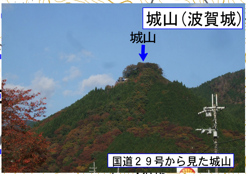
国道29号から見た城山