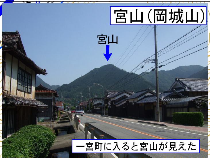
一宮町に入ると宮山が見えた