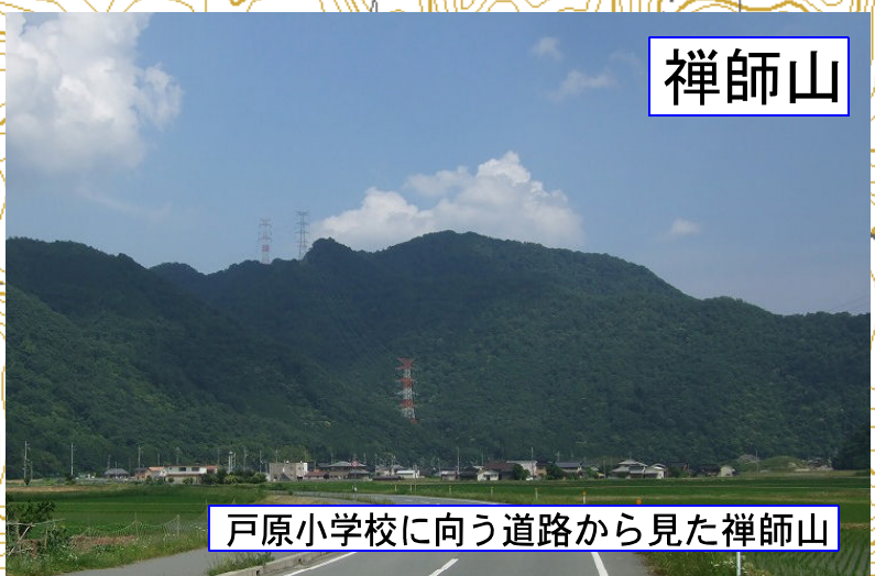
戸原小学校に向う道路から見た禅師山