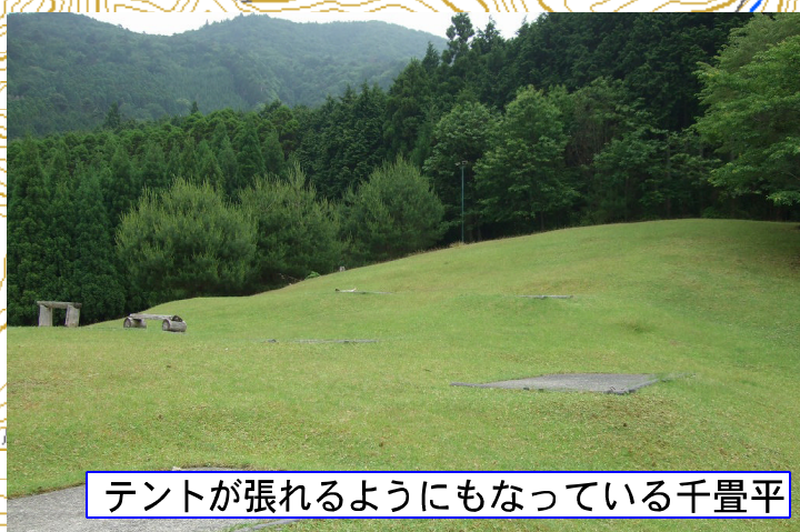
テントが張れるようにもなっている千畳平