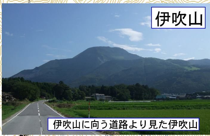
伊吹山に向う道路より見た伊吹山