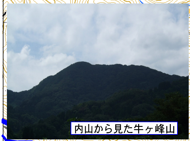
内山から見た牛ヶ峰山