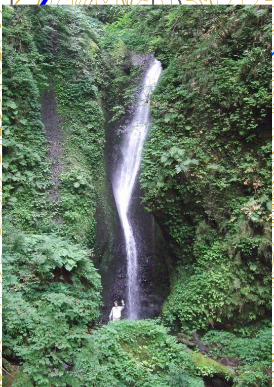
くの字に曲がった桂の滝