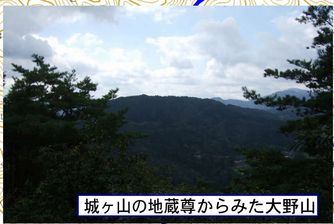
城ヶ山の地蔵尊からみた大野山