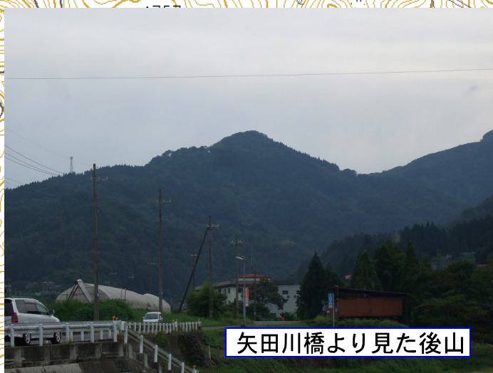
矢田川橋より見た後山