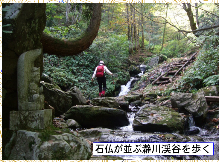
石仏が並ぶ瀨川溪谷を歩く