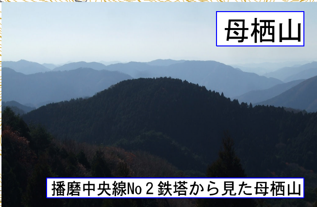
播磨中央線No2 鉄塔から見た母栖山