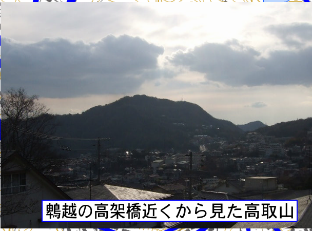
鶴越の高架橋近くから見た高取山