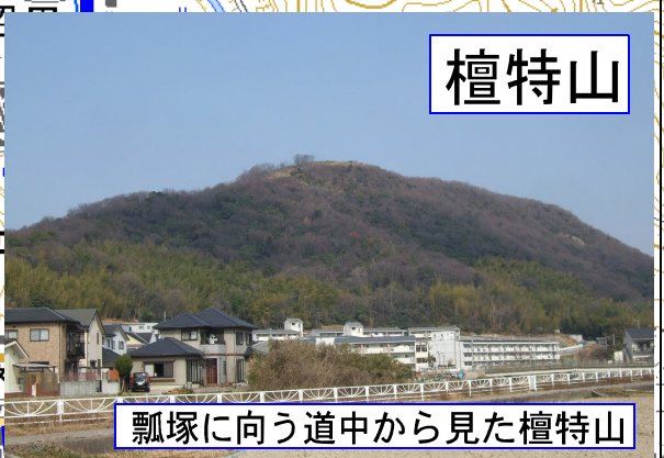
瓢塚に向う道中から見た檀特山