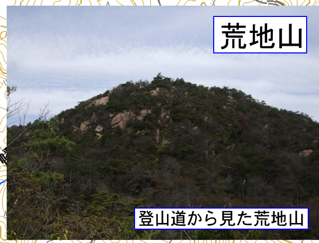
登山道から見た荒地山