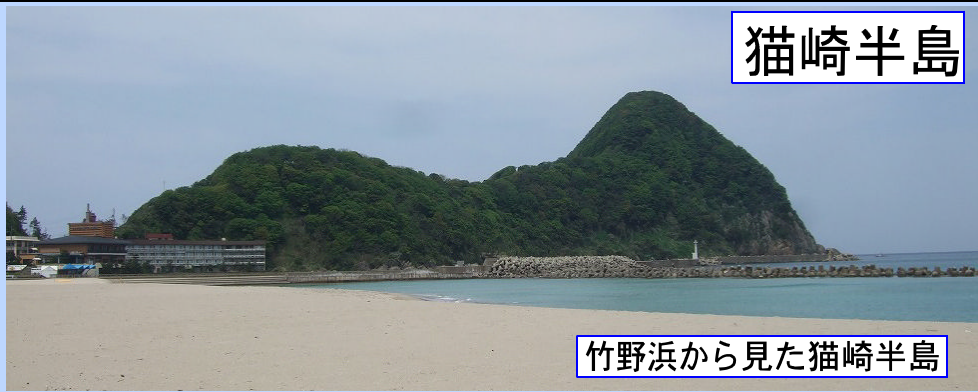
竹野浜から見た猫崎半島