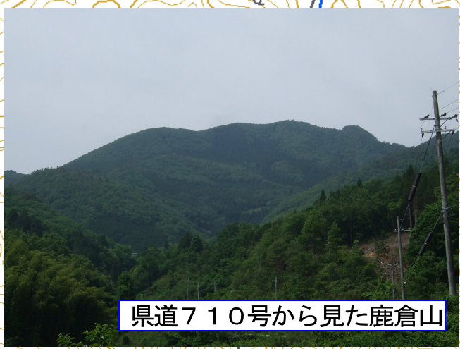
県道710号から見た鹿倉山