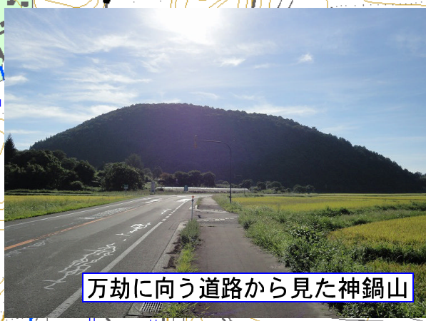
万劫に向う道路から見た神鍋山