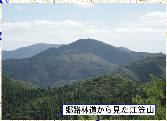
郷路林道から見た江笠山