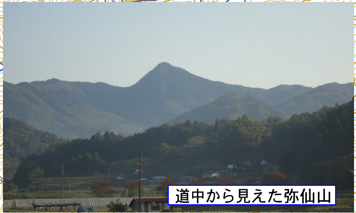
道中から見た弥仙山